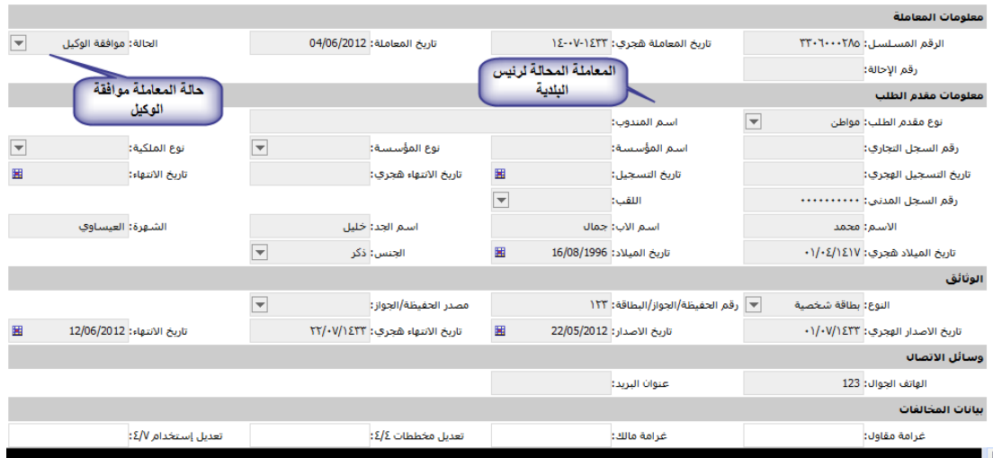
الشكل ١، ٤، ٩