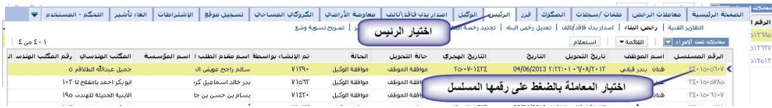
الشكل ١، ٣، ٩