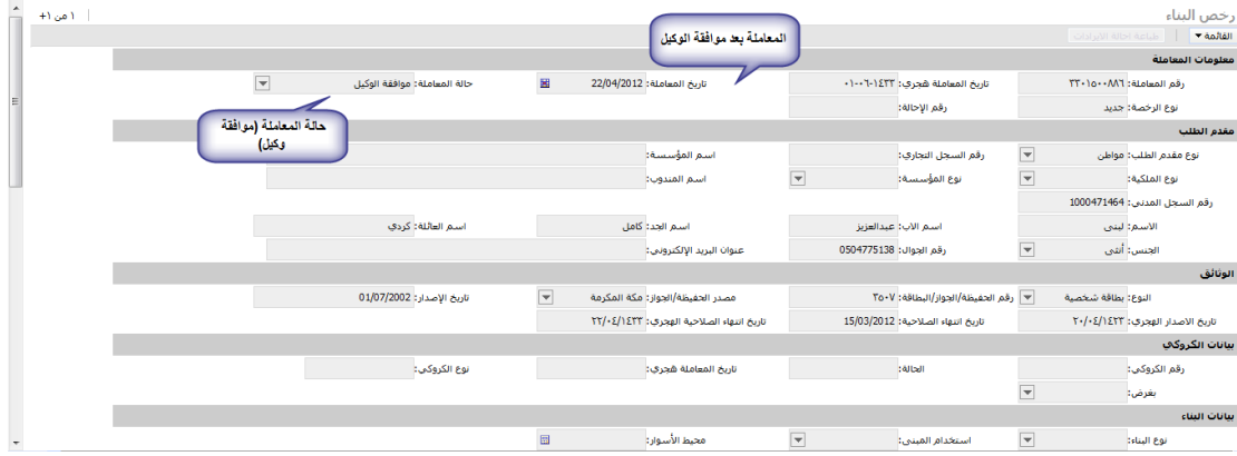
الشكل ١، ٢، ٣، ٨